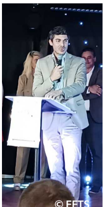
M. Aurélien Pradié