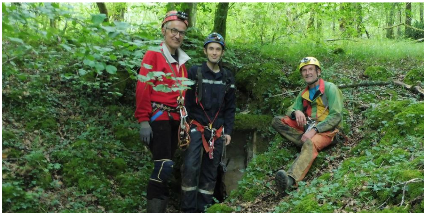
Les spéléologues devant l'entrée naturelle de la grotte, découverte en 1953.