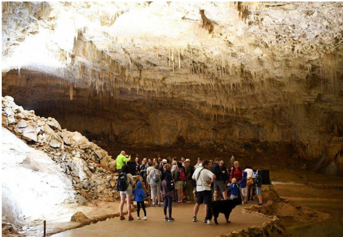
Grotte de Choranche en Isère

Bus & Car - Tourisme de Groupe | Loisirs | publié le : 27.06.2019 | Dernière Mise à jour : 27.06.2019