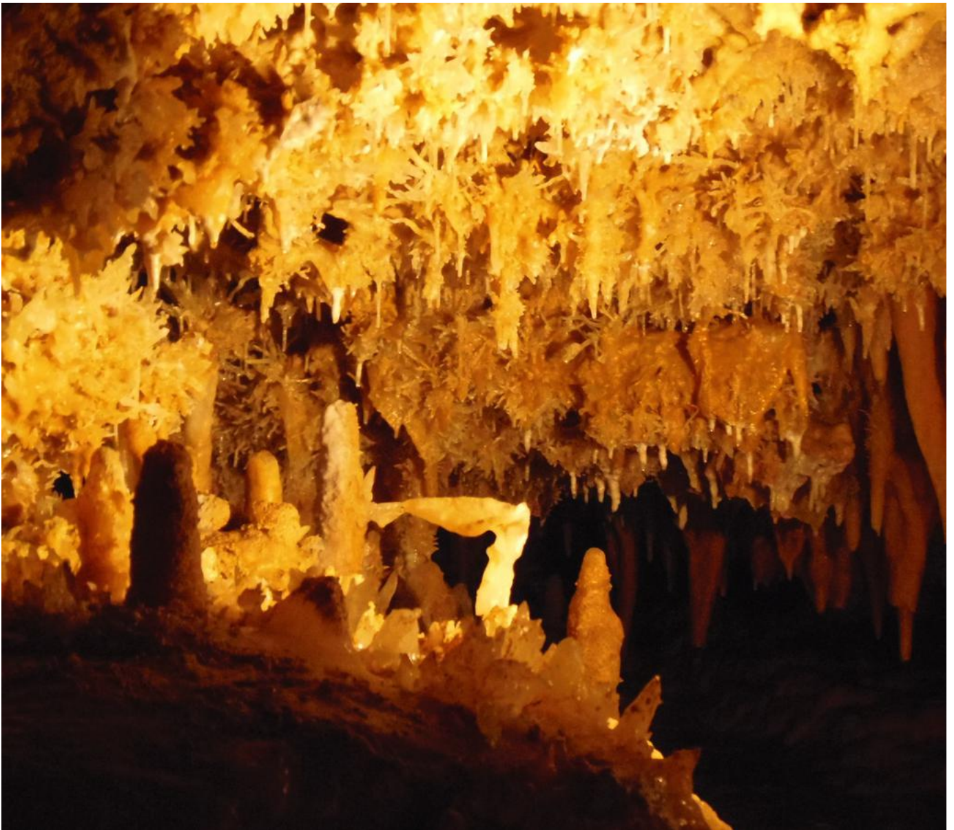
☒ Concrétion du Grand Roc dite « de la victoire de Samothrace ». Léna Badin

Après une présentation des abris de Laugerie-Basse au fil du temps (de l'arrivée de l'Homme dans la vallée de la Vézère à la Préhistoire, jusqu'aux fouilles ayant permis la découverte de l'abri des Marseilles), les visiteurs s'approcheront de la grotte du Grand Roc pour la visiter à lueur des lampes-tempête. De renommée internationale, ce chef-d'œuvre naturel offre tout au long de la visite un véritable chemin de cristaux, parsemé de coulées de calcite, de stalagmites et de stalactites imposantes et translucides, dont les formes défient les lois de la pesanteur.