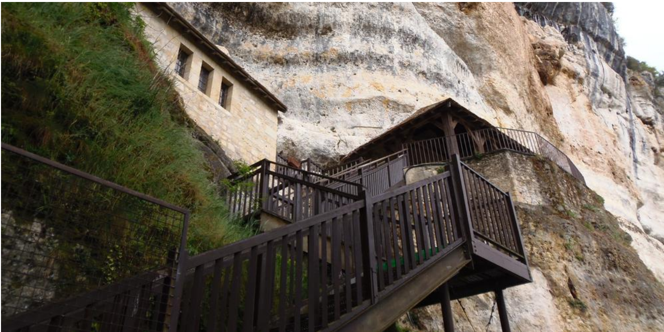
📷 La grotte du Grand Roc a été découverte par Jean Maury en 1924.

Par Léna Badin Publié le 03/06/2022 à 12h53 S'abonner