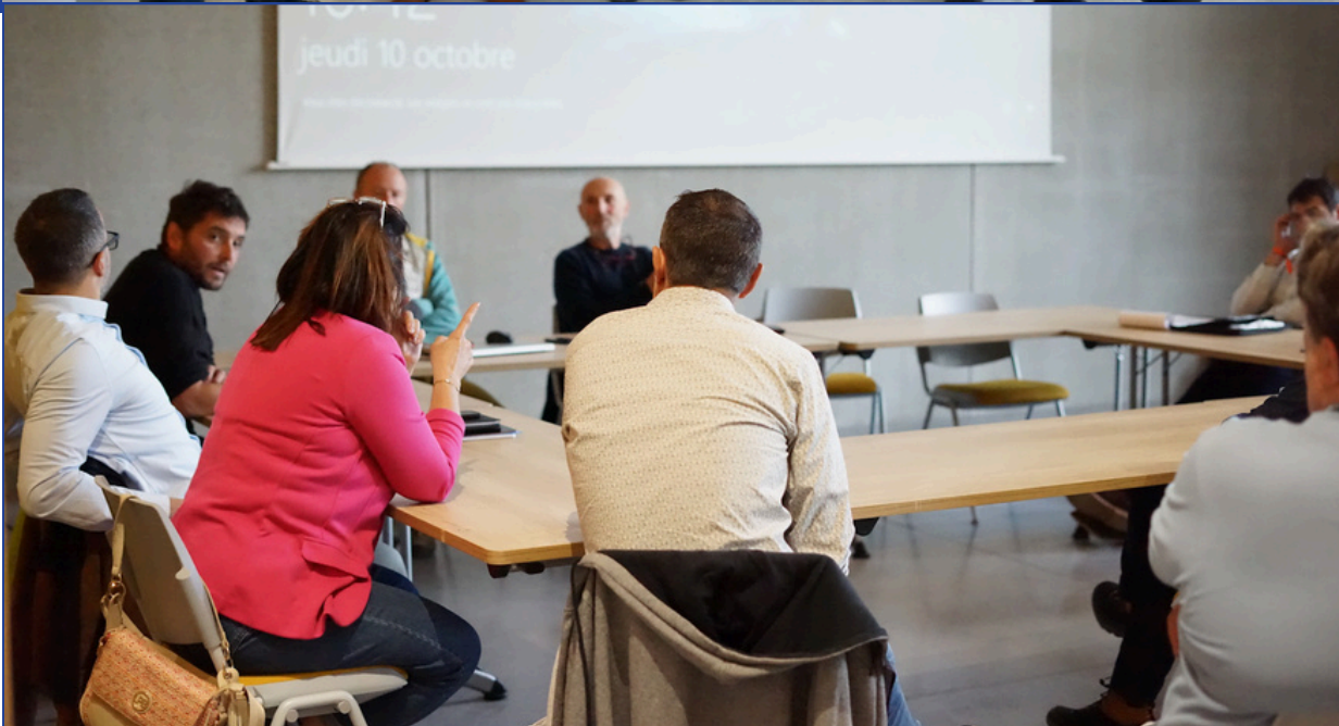
Accueil des adhérents dans l'espace adhérents de la Fédération Française du Tourisme et Patrimoine souterrain – FFTS.

Cliquez sur une rubrique pour voir les documents !