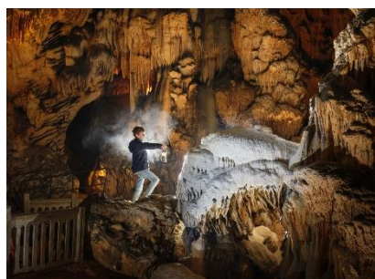
Grotte des Demoiselles

Contact presse : Roselyne Aulner, 06 30 94 01 72 ou contactanecat@gmail.com .