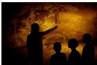
Grotte de Niaux R. Kann ©