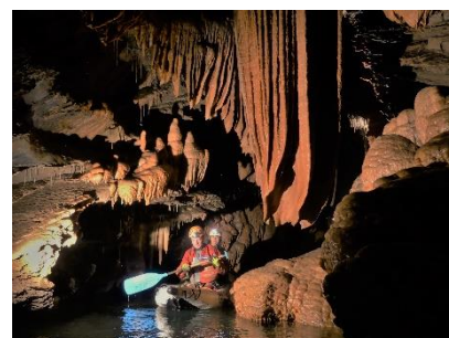
Gouffre géant de Cabrespine