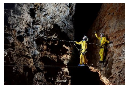
Grotte de Clamouse ©

Contact presse : Roselyne Aulner, 06 30 94 01 72 ou contactanecat@gmail.com .