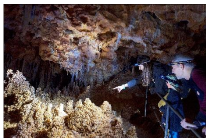
Aven Grotte Forestière ©