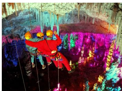
Grotte de la Salamandre