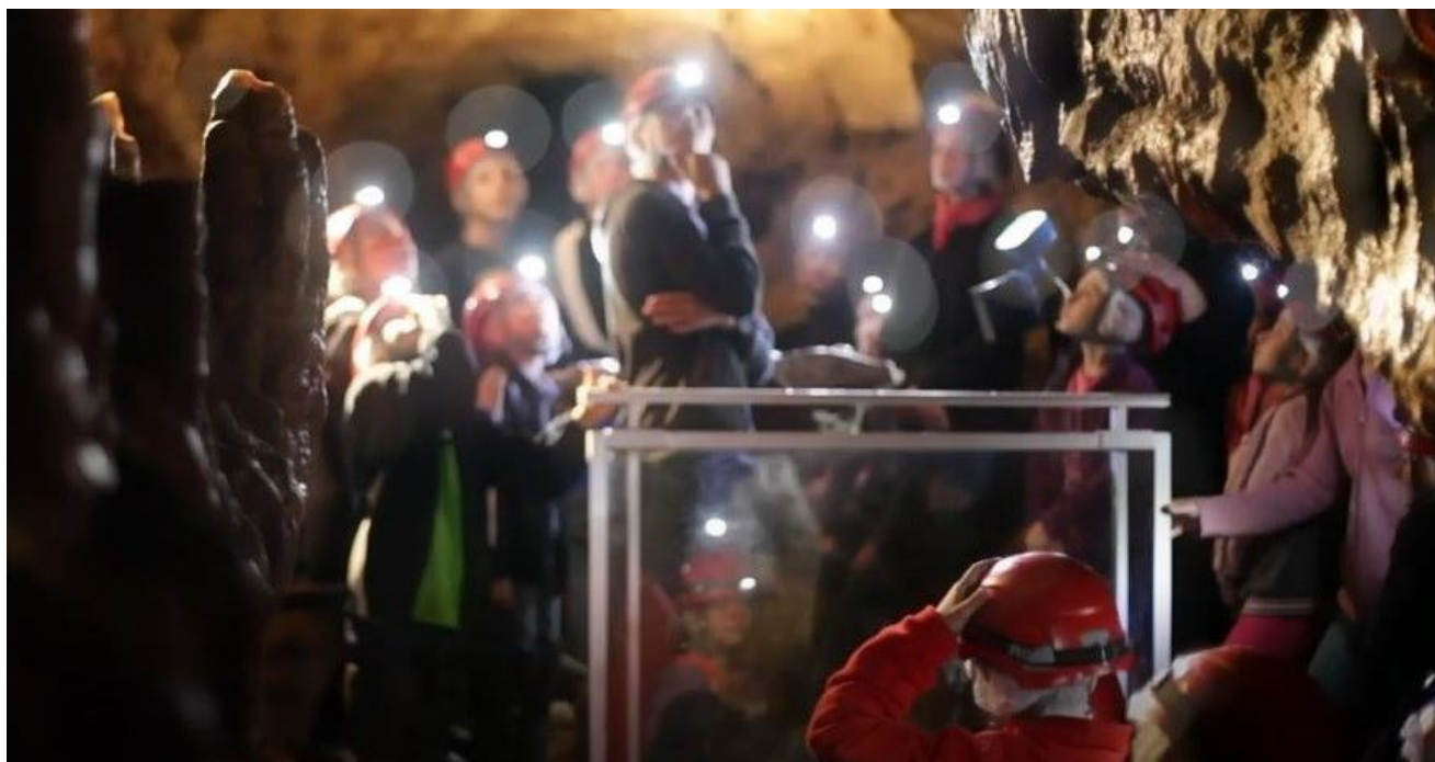
Grotte Célestine de Rauzan ©