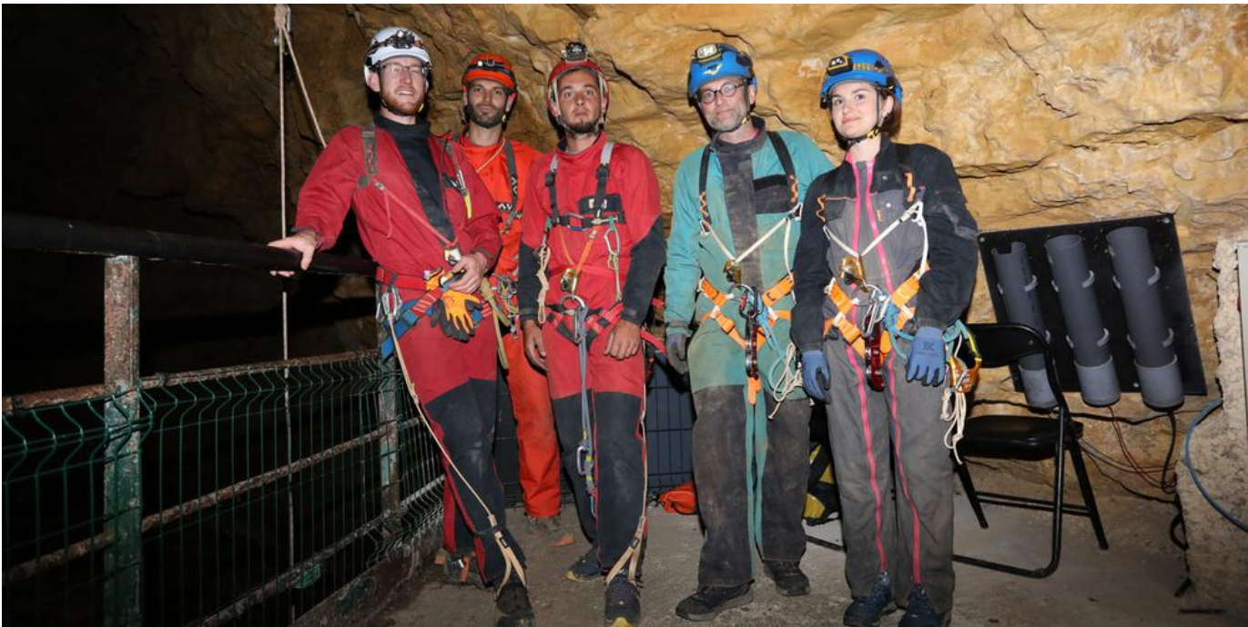
📷 Le Spéléo Club de Périgueux a fait des démonstrations de descente dans le gouffre.

Par Christian Lacombe Publié le 09/06/2022 à 17h43 S'abonner